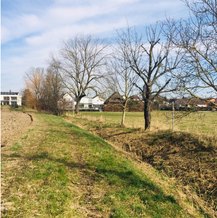
Bild 1: Graben am östlichen Rand im Gewässerrandstreifen, Blick nach Norden.